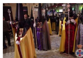
Señas de identidad