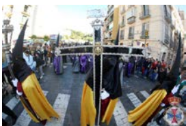
La procesión 2023