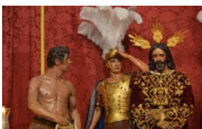
Actos y cultos 2023