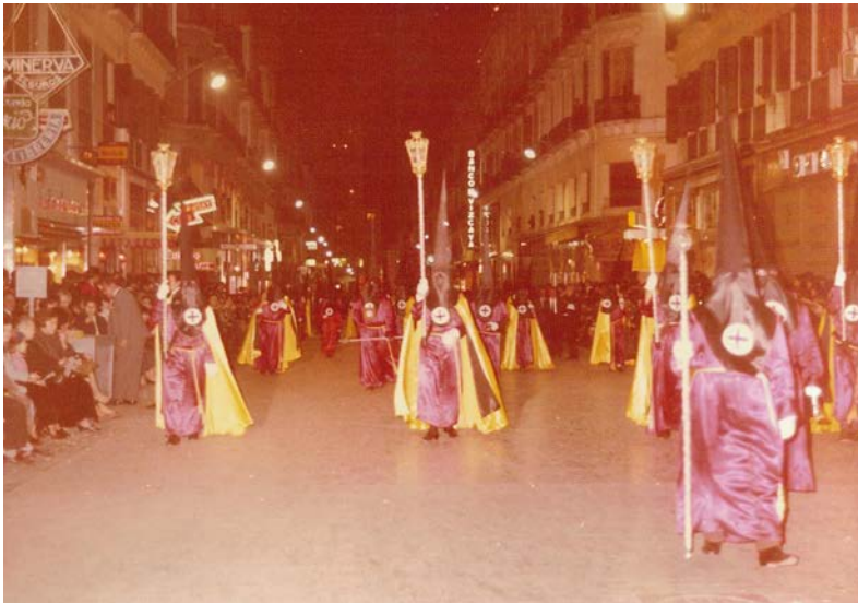
Sección de faroles por calle Larios, Martes Santo 24-3-1970.